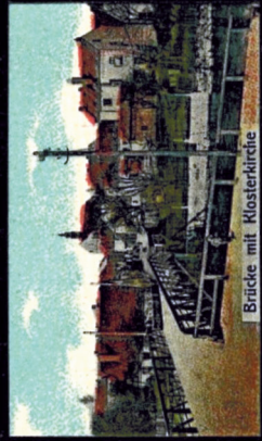
Brücke mit Klosterkirche