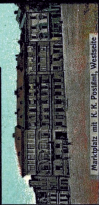
Marktplatz mit K. K. Postamt, Westseite